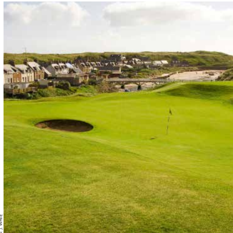
D. J. WHITE

Autant de singularités qui font tout le charme d'un parcours gâté en trous typiques – comme ci-contre et en bas à droite. Pour en apprécier toute l'étendue, rien ne vaut la vue spectaculaire du club-house (ci-dessus).