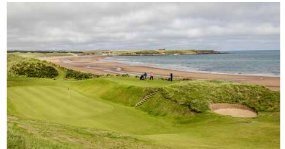
► OP DE VEERTIENDE HOLE VAN CRUDEN BAY SLA JE EEN BLINDE SLAG NAAR EEN VIERKANTE GREEN.

spelers per jaar) werd dat veel te klein. Ook Cruden Bay kent een paar vreemde holes. Hole drie is een haalbare par-4 hole, als je weet wat je doet. Je kunt de green niet zien en je mag pas afslaan als op de paal naast de tee een groen lampje brandt. Na het afslaan moet je op het knopje drukken om het lampje weer op rood te zetten. Bij de tee van hole vier staat net zo'n paal waarmee je dan het lampje op groen kunt zetten. Over die vierde hole gesproken: dit is de twee moeilijkste par-3 hole van Schotland. Het is niet zozeer de lengte van 180 meter die de hole lastig maakt, maar alle afzwaaiers of te lange ballen verdwijnen in het diepe helmgras. Verder zul je ontdekken dat Cruden Bay veel blinde slagen heeft, dus ook hier is een caddie van grote waarde. Op hole negen word je beloond