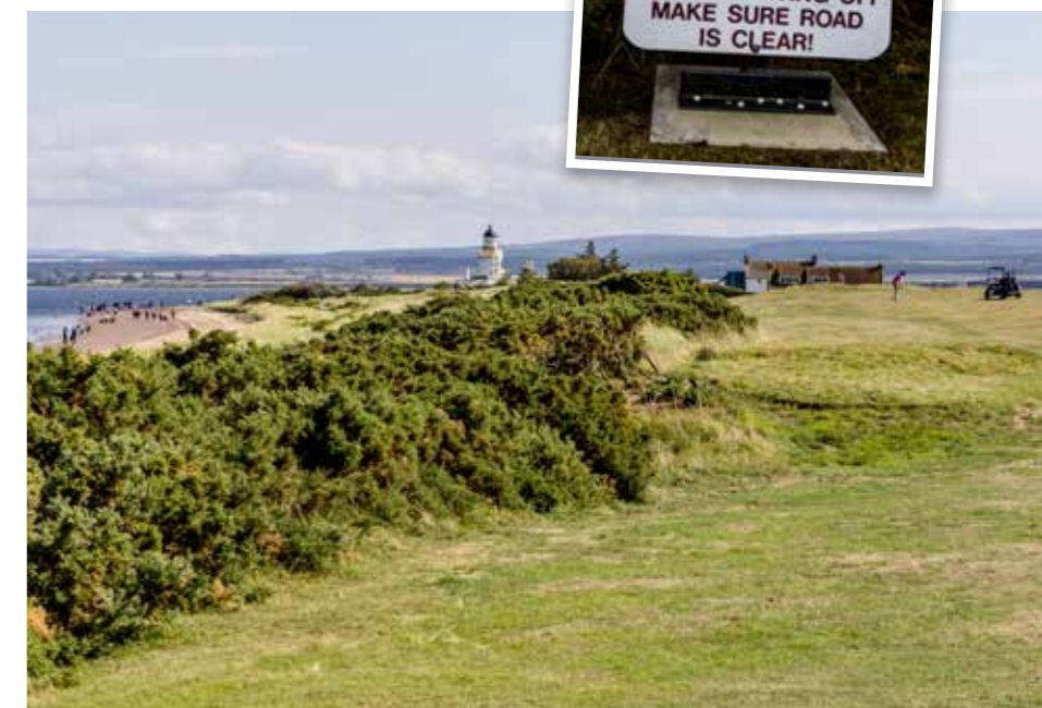
► BIJ SHANONRY POINT KUN JE DOLFIJNEN ZIEN.