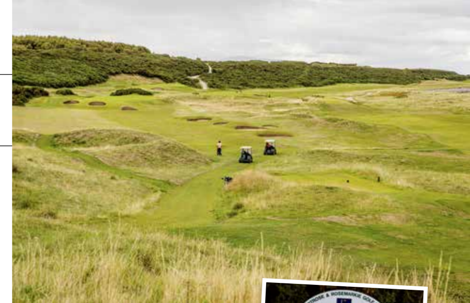
► NARE BUNKERS BESCHERMEN DE GREEN VAN HOLE VIJF OP ROYAL DORNOCH.