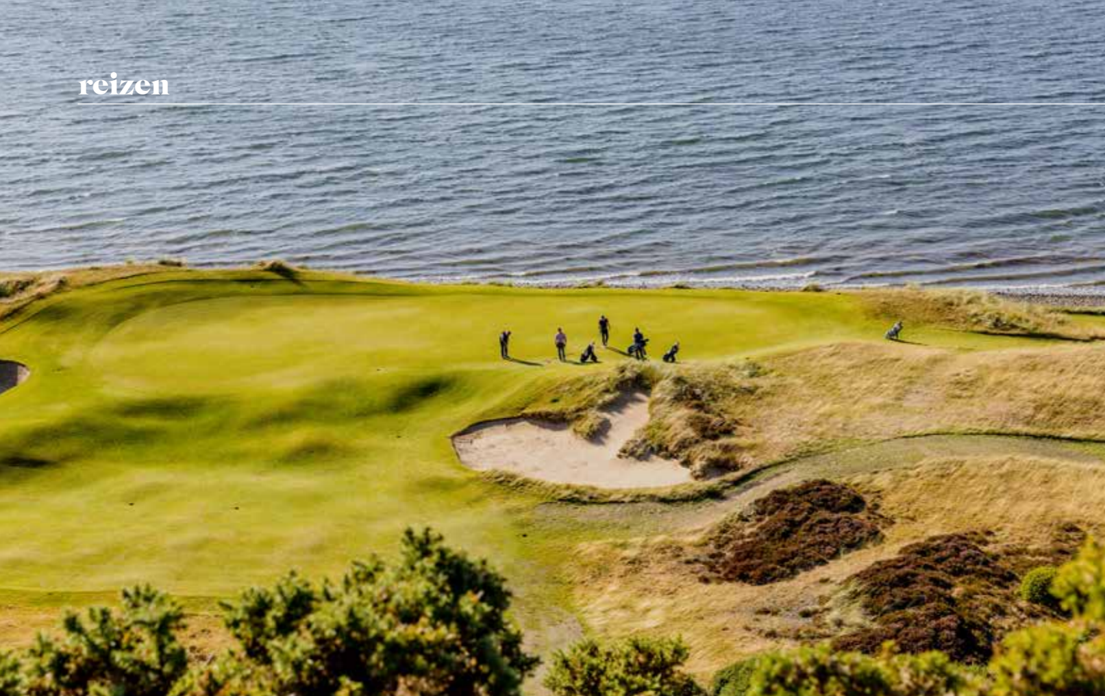
► OP HET JONGE CASTLE STUART WERD AL VIER KEER HET SCHOTS OPEN GESPEELD.