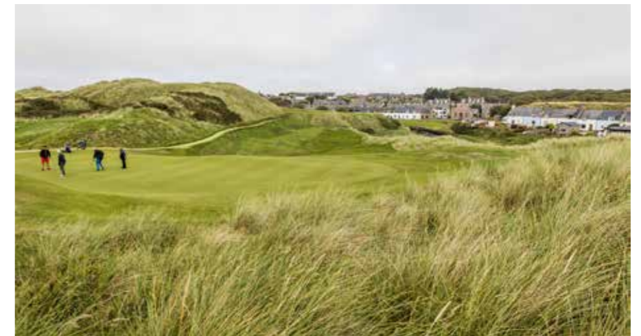
► CRUDEN BAY IS EEN WAARDIGE AFSLUITER VAN EEN GEWELDIGE TRIP.