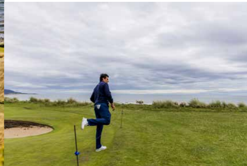
► OP BRORA HOUDT SCHRIKDRAAD DE SCHAPEN VAN DE GREEN.