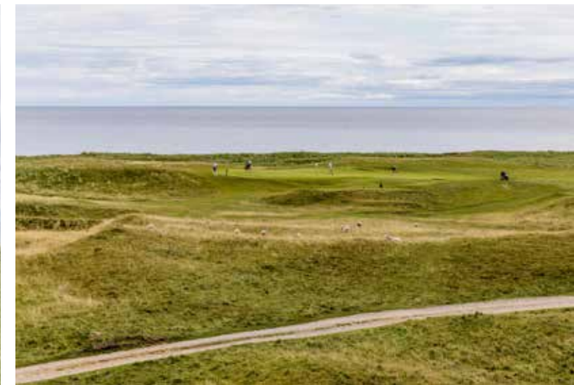
► BAL IN DE SCHAPENPOEP? JUST PLAY IT AS IT LIES, SIR.