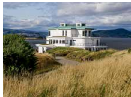
► HET OPVALLENDE CLUBHUIS VAN CASTLE STUART.