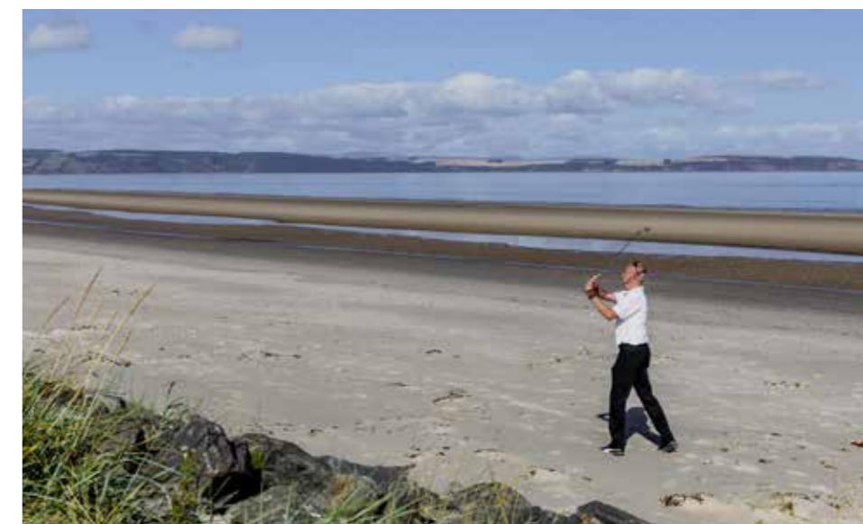
► HET STRAND NAAST NAIRN IS NIET OUT-OF-BOUNDS, DUS GEWOON BLIJVEN PLOETEREN.